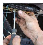
Manos. Lavado industria