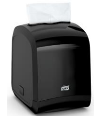
Tork Xpressnap® Fit™ Dispensador DI70077